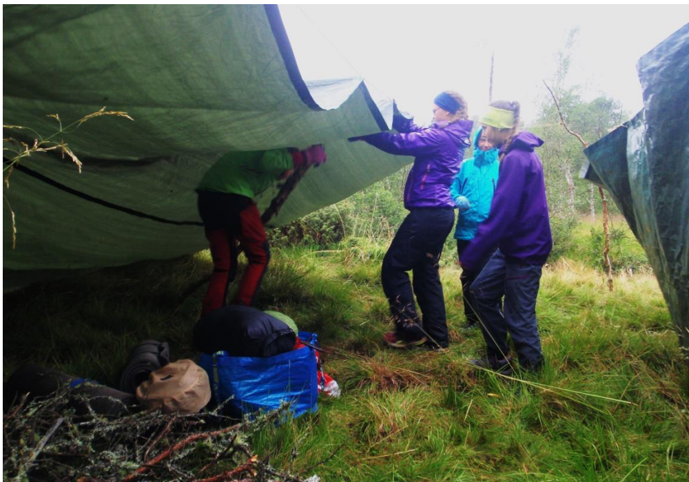
Vel framme der vi skulle slå leir for natta hadde regnet begynt å bømte ned. Alle arbeidet derfor for fullt med å få opp de to presenningene som skulle tjene som bolig, sanke ved, skifte til tørre klær og få fyr på bålet