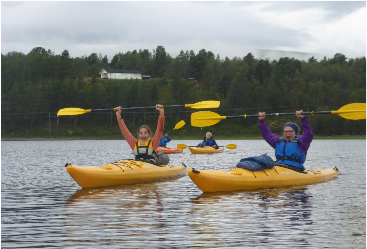
Glade kajakkpadlere på Stubsjøen.