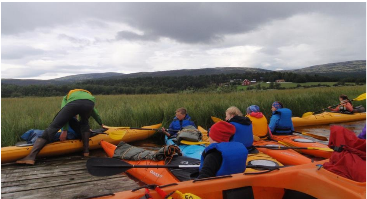
Noen små utfordringer må man ha.