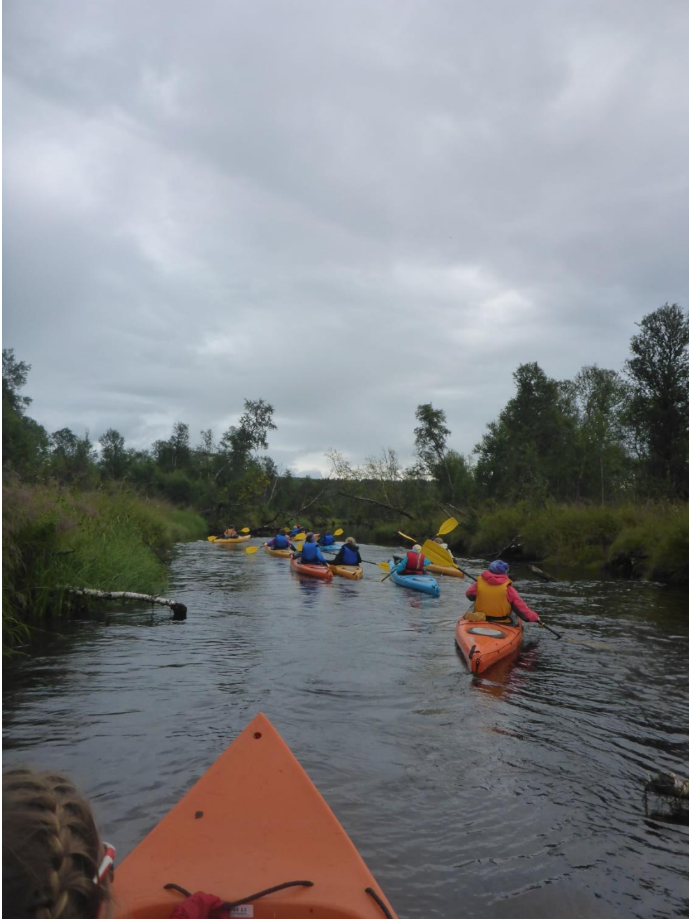
Lang rekke av kajakkpadlere på tur nedover Tunna.